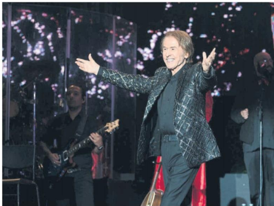
Raphael nada más pisar el escenario del Jardins de Pedralbes de Barcelona

A los recitales de Raphael el público viene cantado y se va cantado y satisfecho. Son tantos los registros en una sola función. Nunca falta un tramo romántico,